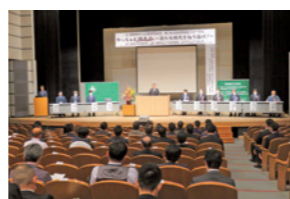
全県経営フォーラム

経営者の総合的人間力を高める「同友会大学」をシリーズで開校しています。各講座では社会科学、経済学、経営学、哲学などをテーマに学びあいます。