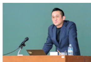
静岡大学連携講座