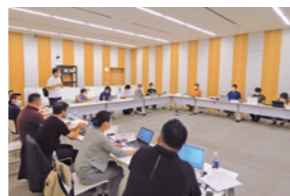
経営指針を創る会