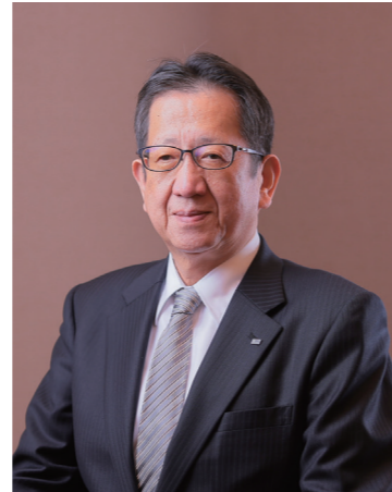
株式会社能作 代表取締役会長(富山同友会)

時代を切り開き、地域とともに成長する能作の経営法等々についてご講演をいただきます。