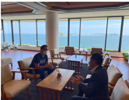
ホテルのロビーで打合せ