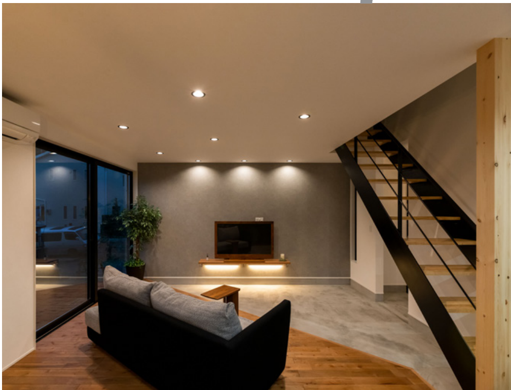
(株)ハウスプランで設計・施工した住宅